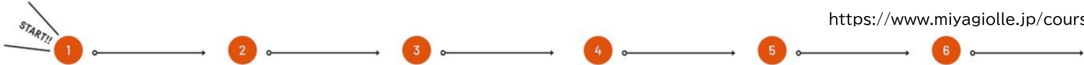
1 JR 仙石線多賀城駅 (スタート0.0km)

https://www.miyagiolle.jp/course/tagajo/