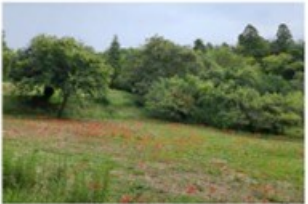
7 多賀城跡作賞地区 (5.5km)

春にはヤマブキやシャガ(アヤメ科)が、秋にはヒガンバナといった万葉植物を楽しむことができます。