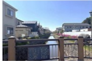
2 野田の玉川・おもわくの橋(歌枕) (0.5km)

新緑の季節には満開のツツジが道標となります。平安中期、能因法師が歌枕「野田の玉川」を詠んだ歌にちなみ、江戸時代に仙台藩によって整備されました。道中には平安後期に安倍貞任が女性「おもわく」のもとへ通ったとされる「おもわくの橋」があり、歌枕「おもわくの橋」を詠んだ西行の歌も記されています。