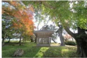
9 多賀城碑(歌枕「壺碑」) (8.2km)

多賀城の創建(724年)と修造(762年)の年が刻まれた、141文字からなる日本三古碑の一つで、国宝に指定されています。歌枕「壺碑」としても知られ、西行や源頼朝が和歌に詠み、松尾芭蕉も『おくのほそ道』に記しています。