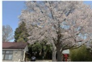
3 天満宮の桜 (2.1km)

留ヶ谷の旧家の氏神から「留ヶ谷村」の鎮守として祀られるようになったこの場所では、春には大きな桜が咲き誇ります。