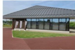
11 多賀城跡ガイダンス施設 (フィニッシュ8.5km)

約1300年前の古代都市・多賀城の映像を大型モニターで楽しめるほか、南門復元の記録映像や3Dモデルによる古代の建物、出土品に触れることができます。また、特別史跡の歴史を学べるほか、御城印やお土産も購入できます。