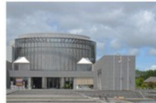
5 東北歴史博物館 (3.5km)

東北の多彩な歴史と文化を紹介する博物館で、旧石器時代から現代までを資料や模型で学べます。江戸時代の古民家を移設した「今野家住宅」や、子ども向け体験スペース、レストラン、ミュージアムショップもあります。