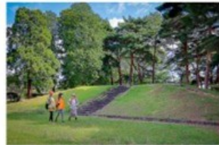
4 多賀城廃寺跡 (2.9km)

多賀城とほぼ同じ8世紀前半に創建された付属寺院で、塔と本尊をまつる金堂が向き合っており、東西に並ぶ伽藍配置は、福岡県の大宰府の付属寺院である観世音寺と共通しています。昭和41年に特別史跡に指定され、東日本初の史跡公園として整備されました。