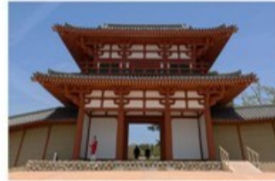
10 多賀城南門 (8.3km)

2024年に多賀城創建1300年を記念し、古代東北の政治・文化・軍事の拠点だった多賀城の正門が復元されました。かつて東北地方の中心として発展した国府多賀城の正門にふさわしい、堂々たる荘厳な姿を示しています。