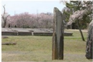
8 多賀城政庁跡 (7.8km)

奈良の平城宮跡、福岡の大宰府跡と並び日本三大史跡に数えられる多賀城跡の最も重要な場所となっています。奈良・平安時代には陸奥国の国府が置かれ、重要な政務や儀式が行われました。春には桜の名所にもなっています。