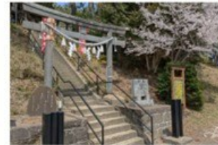
6 浮嶋神社 (4.7km)

新古今和歌集に収められ、山口女王が恋人である大伴家持へ贈ったとされる歌に詠まれた歌枕「浮嶋」が、いまの「浮嶋神社」だと言われています。